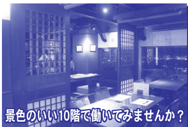
景色のいい10階で働いてみませんか?

休日/日曜日 待遇/各種保険完備、制服貸与、寮完備 応募/電話連絡の後、履歴書(写真貼付)持参にて随時面接致します。